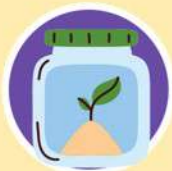
ผลิตและขยายพันธุ์พืช จากการเพาะเลี้ยงเนื้อเยื่อ