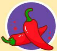
ผลิตเมล็ดพันธุ์ผักพื้นบ้าน พันธุ์ผสมเปิด (OP)