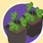
ผลิตและขยายต้นพันธุ์ พืชผัก/พืชอาหาร