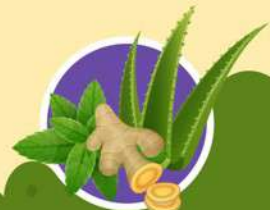
ผลิตและขยายต้นพันธุ์ พืชสมุนไพร Product Champion

ทั้งนี้ กรมส่งเสริมการเกษตร ได้ส่งเสริมและให้บริการองค์ความรู้ด้านพืชพันธุ์ดี แก่เกษตรกรและผู้ที่เกี่ยวข้อง ผ่านจุดบริการพืชพันธุ์ดี Doae ของศูนย์ขยายพันธุ์พืช ทั้ง 10 แห่งทั่วประเทศ รวมถึงระบบ DOAE Marketplace ในการสั่งซื้อพืชพันธุ์ดีอีกด้วย