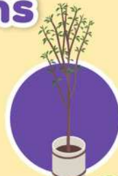
ผลิตและขยายต้นพันธุ์ ไม้ผล/ไม้ยืนต้น หรือพืชเศรษฐกิจ